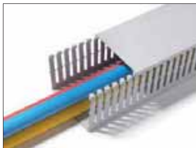
Halogenfrie kabelkanaler egner seg i høyrisiko-områder.

Disse kabelkanalene egner seg meget godt i høyrisiko-områder. De benyttes bl.a. innenfor offentlig transport, i heiser og i tunneller. Ingen giftige eller korrosive gasser avgis, da de er produsert i modifisert PPO og er halogenfrie.